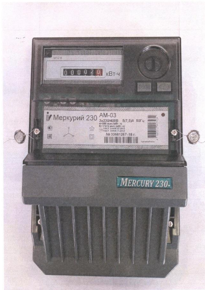
Рисунок 1- Общий вид счетчика с закрытой клеммной крышкой

Общий вид счётчиков электрической энергии трёхфазных статических «Меркурий 230АМ» представлен на рисунке 1.